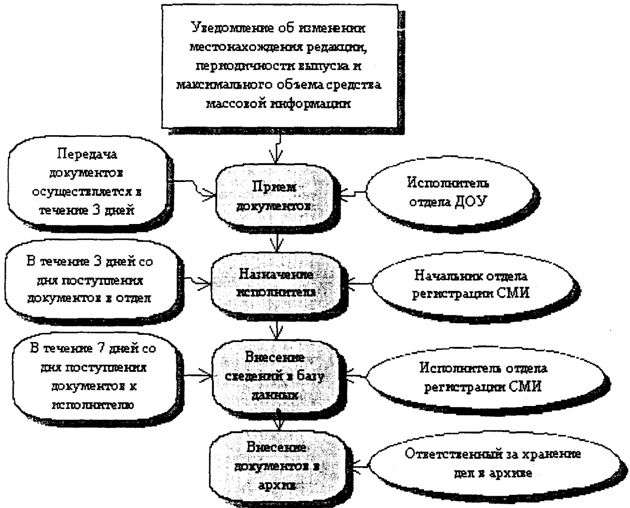
Блок-схема административной процедуры. Выдача дубликата свидетельства о регистрации СМИ